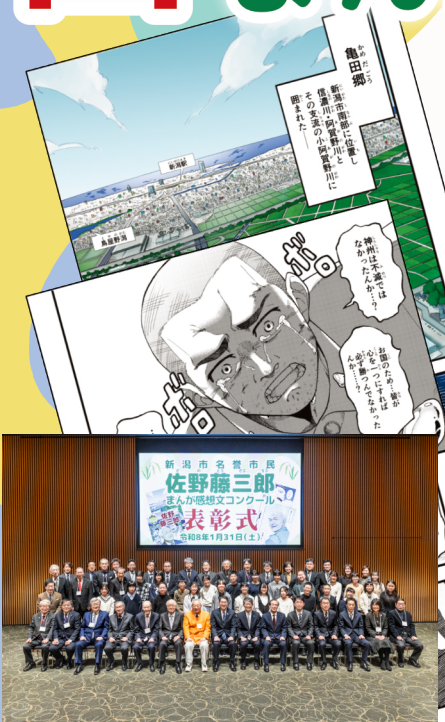
▲第1回表彰式の様子