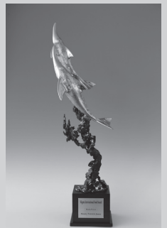
正賞「シュプリングエン」 宮田亮平氏 作