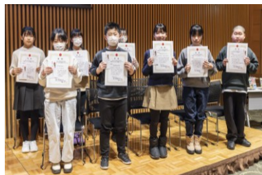
優秀賞受賞の皆さん