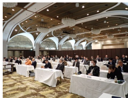
2026年2月9日(月) ホテルイタリア軒

世界情勢は混沌とし、自国ファーストの風潮が増す中、世界は分断化が進み。国際協調や国境を越えた国際協力や支援活動が危機にさらされています。そうした中で、激動する世界情勢と世界の食糧問題等をどう乗り越えられるか、参加者の関心も高かった。