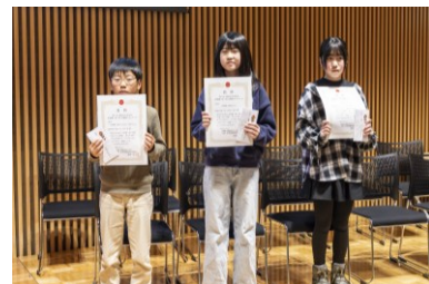
佳作受賞の皆さん