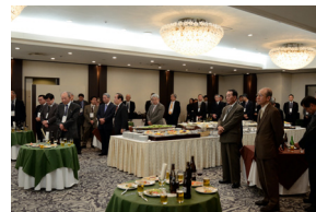
※前回の賀詞交換会・懇親会の様子